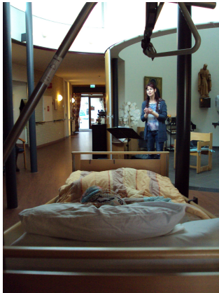
(Hospice de Ark)